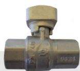
VÁLVULA MACHO ESFÉRICO PARA SELAR