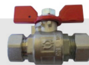
PASSADOR MACHO ESFÉRICO COM BICONE PARA TUBO INOX / MANÍPULO BORBOLETA