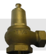
VÁLVULA SEGURANÇA - OR OFFICINE RIGAMONTI MÁX. 12 BAR