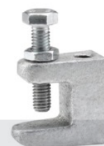
FIXADOR PARA VIGA W1 ZINCADO