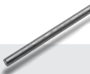
VARÃO ROSCADO ZINCADO