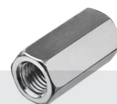
UNIÃO LIGAÇÃO SEXTAVADA PARA VARÃO