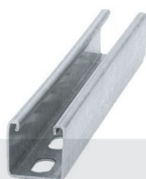
CALHA PERFURADA GALVANIZADA 27/18