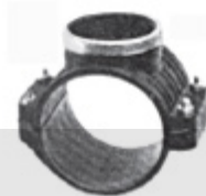
TOMADA DE CARGA EM PP PARA TUBO PE E PVC COM ANEL DE REFORÇO