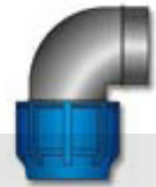
JOELHO A 90° ROSCA FÊMEA