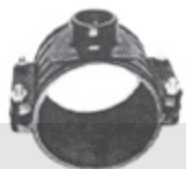
TOMADA DE CARGA EM PP PARA TUBO PE E PVC