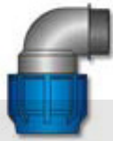
JOELHO A 90° ROSCA MACHO