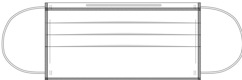
Vista do avesso