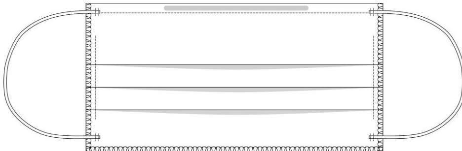
Vista do direito