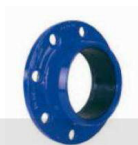
ADAPTADOR DE FLANGE QUICK PVC/BLUTOP